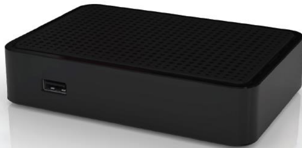
MAG250 IPTV SetTopBox